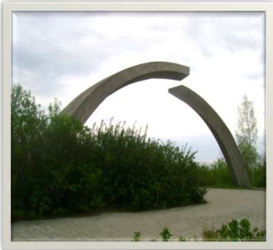
Памятник в честь разрыва блокады Ленинграда!