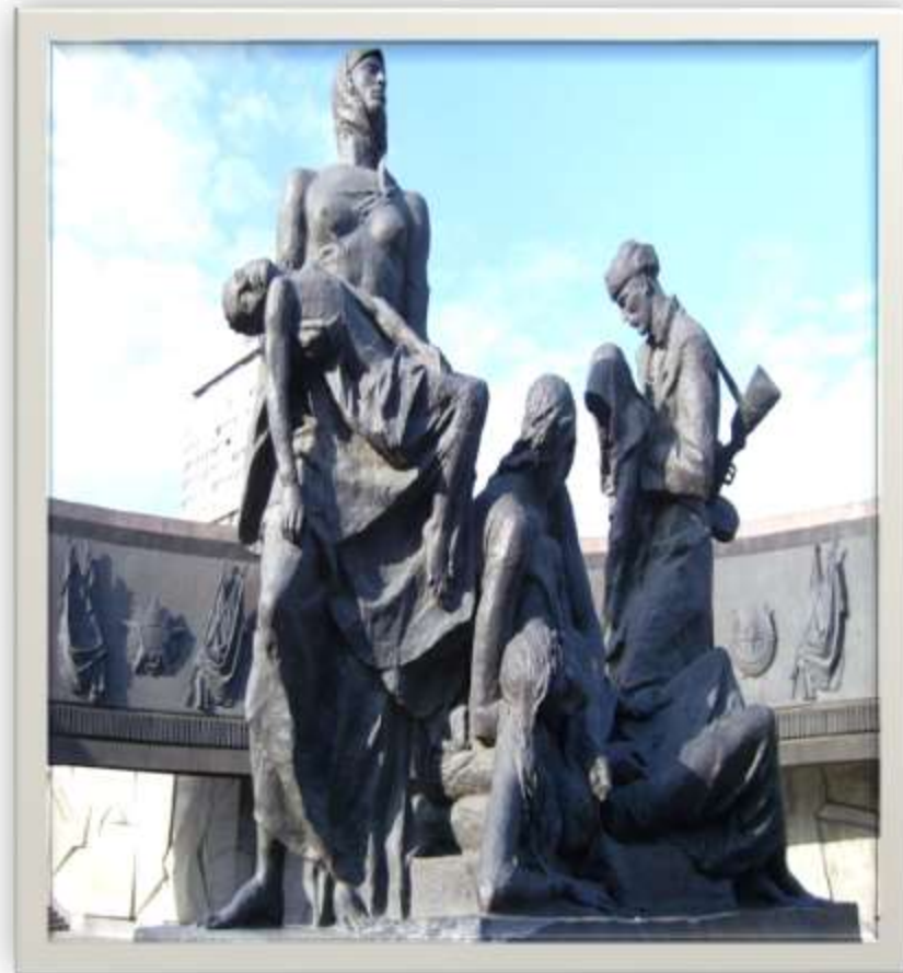
Памятник героическим защитникам блокадного Ленинграда.