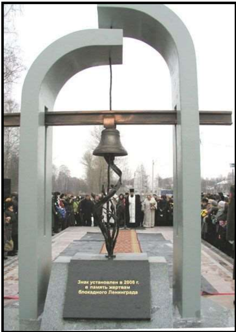
Памятник жертвам блокадного Ленинграда (Ярославль)