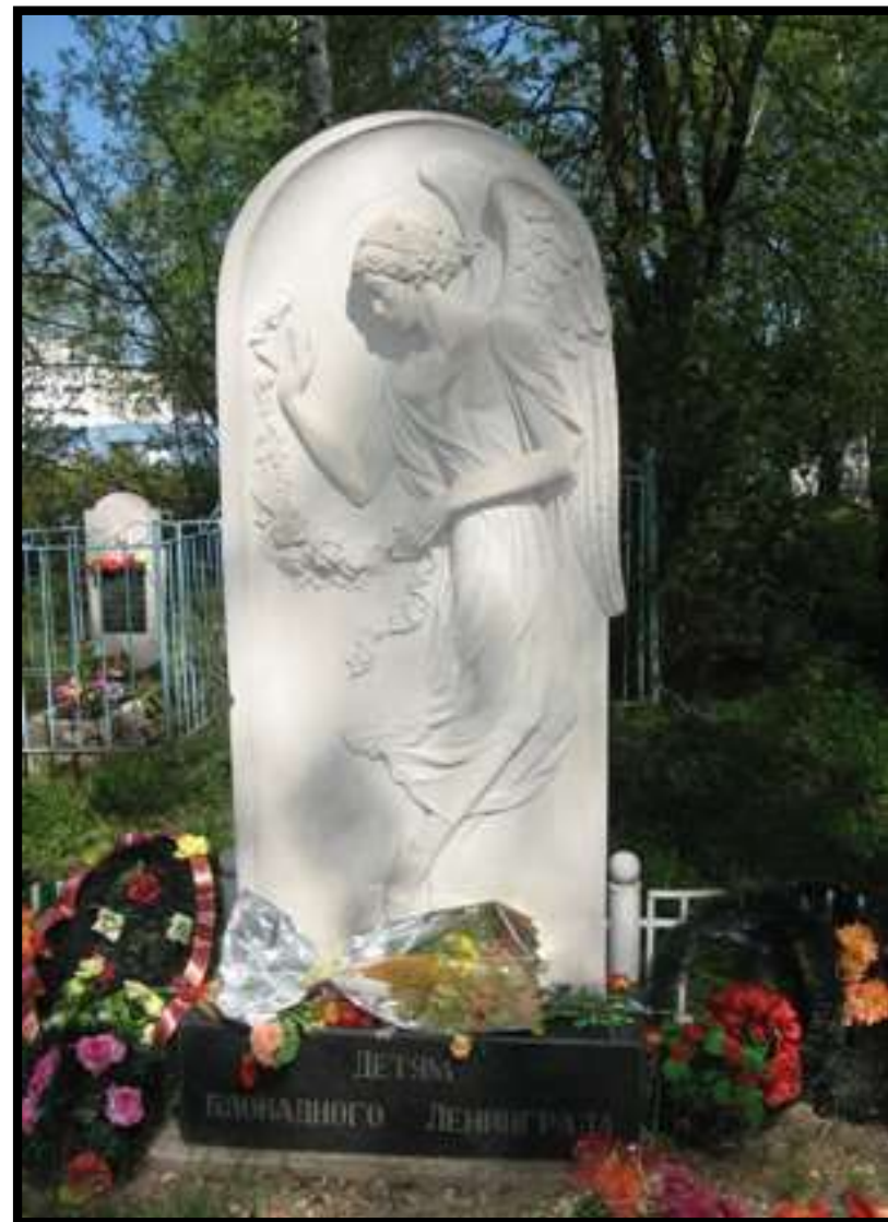
Памятник детям блокадного Ленинграда (Ярославль)